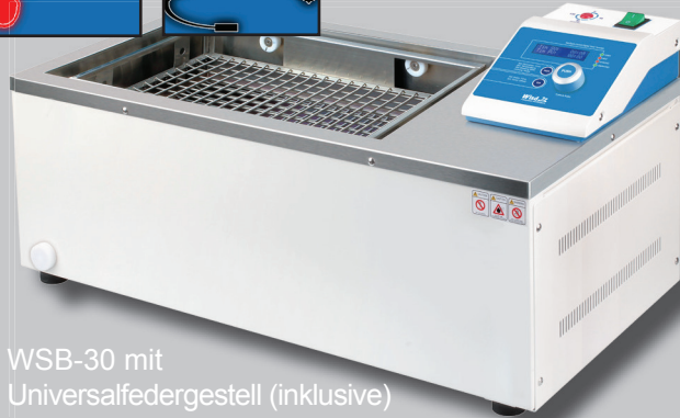
WSB-30 mit Universalfedergestell (inklusive)